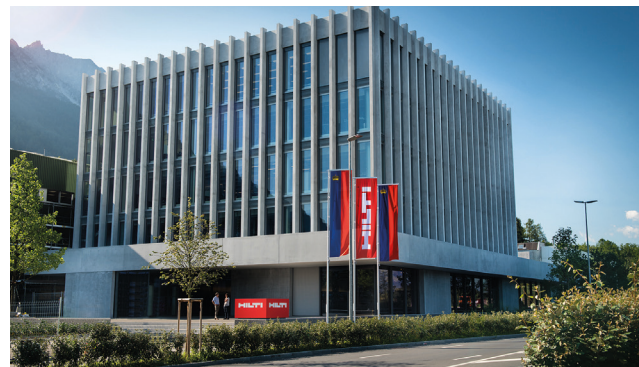
Hilti AG, Schaan LI Ausführung Lüftung, Klima, Heizung/Kälte, MSRL, Service