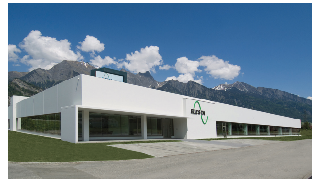
Elesta GmbH, Bad Ragaz Ausführung Lüftung, Klima, Heizung/Kälte, MSR, Service