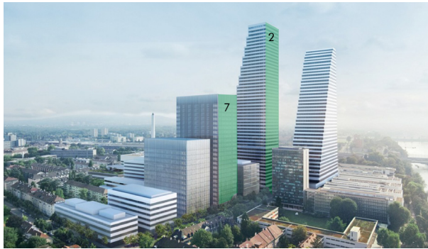
WUEB Hochbord, Zürcherstrasse Dübendorf Ausführung Gesamtprojekt, Lüftung, Heizung, Kälte, MSR