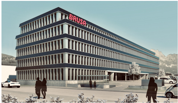
RhyTech-Quartier, Neuhausen am Rheinfall Planung & Ausführung Gesamtprojekt Gebäudetechnik