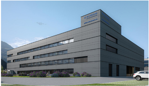
BC-Tech AG, Domat Ems Planung & Ausführung Gesamtprojekt Gebäudetechnik